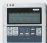
STEROWNIK PRZEWODOWY KJR12B (OPCJA)