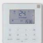
STEROWNIK PRZEWODOWY KJR-120X2